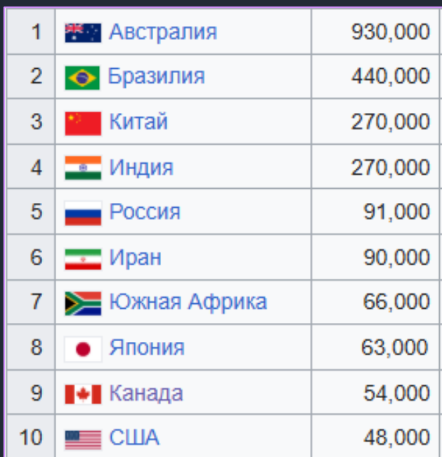
Страны-лидеры по добыче железной руды (тыс. т)

В размещении отрасль тяготеет к железорудным бассейнам или к месторождениям коксующегося угля