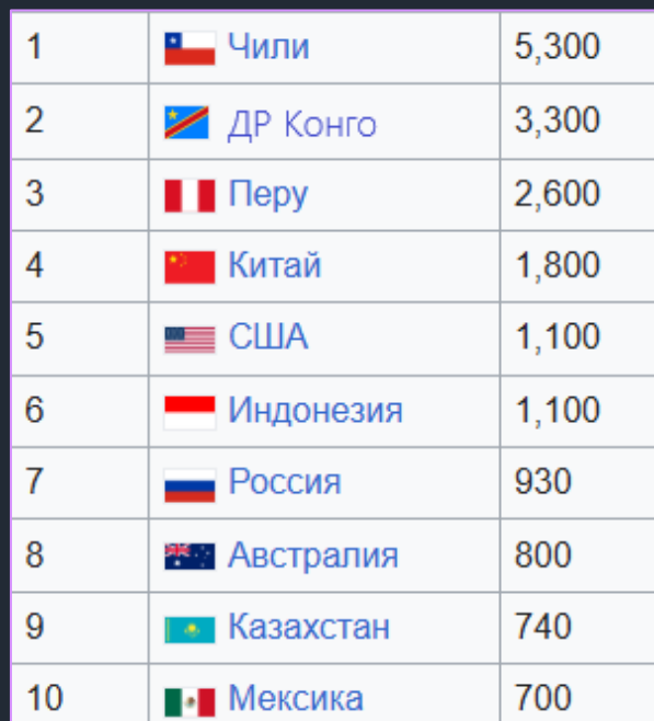
Страны-лидеры по добыче меди (тыс. т)

Главным регионом добычи меди является Латинская Америка (Чили, Перу), однако в последнее время в мире растер роль Китая