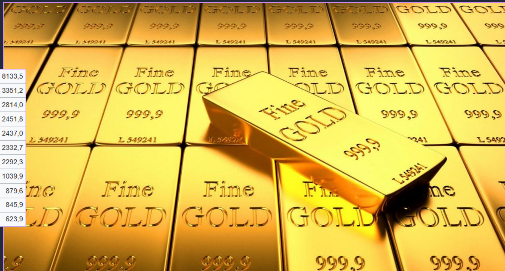
Страны-лидеры по запасам золота (т)

Это запас золота, находящийся в ведении центрального банка и министерства финансов. Является частью золотовалютного резерва, выполняя роль антикризисного резерва для стабилизации курса национальной валюты. Большие запасы золота означают большую экономическую независимость страны