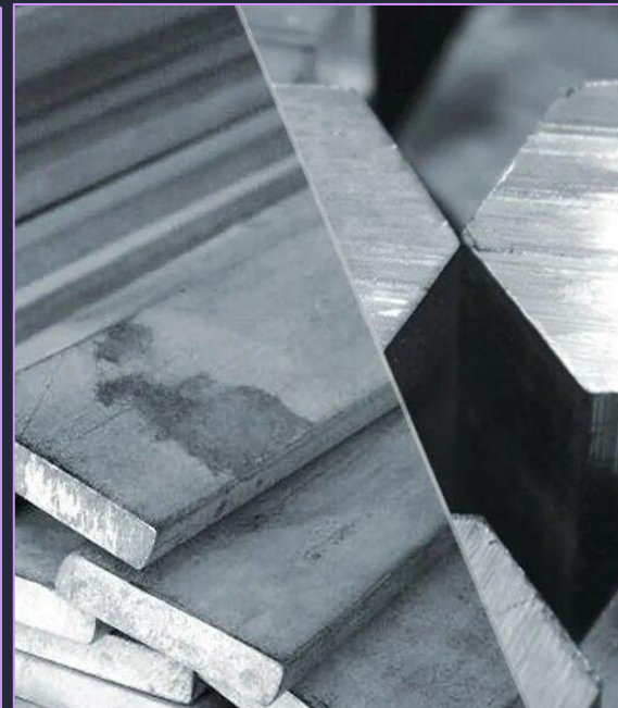
Страны-лидеры по выплавке стали (млн тонн)