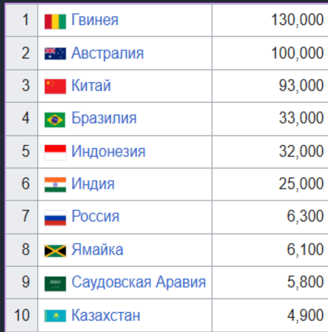
Страны-лидеры по добыче бокситов (тыс. т)