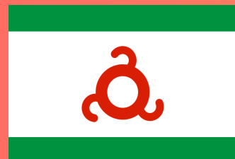
РЕСПУБЛИКА ИНГУШЕТИЯ (Магас)