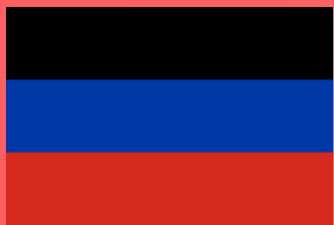
ДОНЕЦКАЯ НАРОДНАЯ РЕСПУБЛИКА (Донецк)