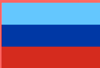
ЛУГАНСКАЯ НАРОДНАЯ РЕСПУБЛИКА (Луганск)