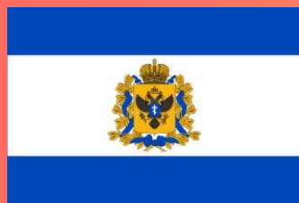
ХЕРСОНСКАЯ ОБЛАСТЬ (Херсон)