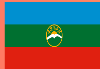
КАРАЧАЕВО-ЧЕРКЕССКАЯ РЕСПУБЛИКА (Черкесск)