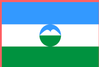
КАБАРДИНО-БАЛКАРСКАЯ РЕСПУБЛИКА (Нальчик)