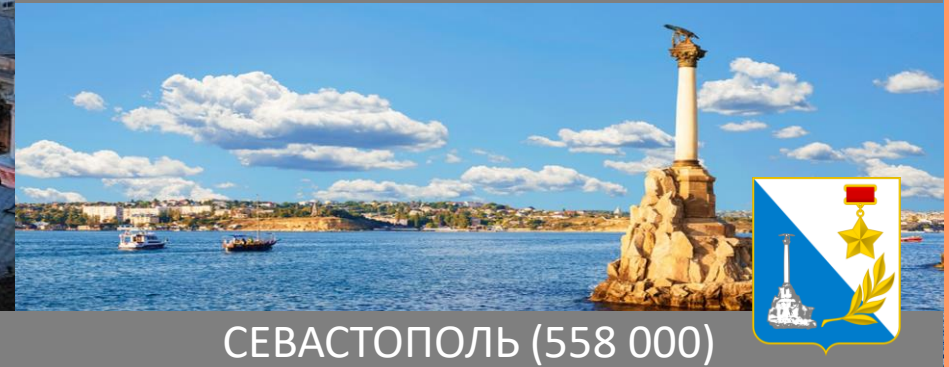
СЕВАСТОПОЛЬ (558 000)