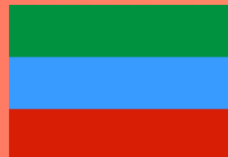
РЕСПУБЛИКА ДАГЕСТАН (Махачкала)