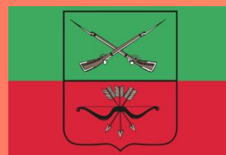
ЗАПОРОВСКАЯ ОБЛАСТЬ (Мелитополь)