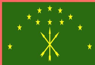
РЕСПУБЛИКА АДЫГЕЯ (Майкоп)