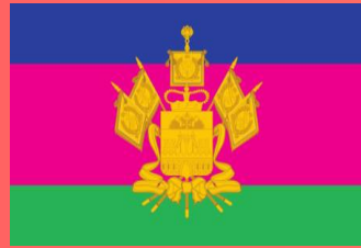
КРАСНОДАРСКИЙ КРАЙ (Краснодар)