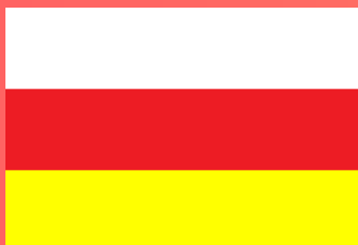
РЕСПУБЛИКА СЕВЕРНАЯ ОСЕТИЯ - АЛАНИЯ (Владикавказ)