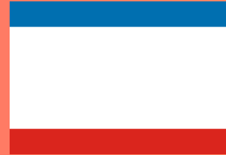
РЕСПУБЛИКА КРЫМ (Симферополь)