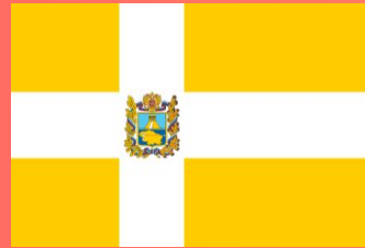
СТАВРОПОЛЬСКИЙ КРАЙ (Ставрополь)