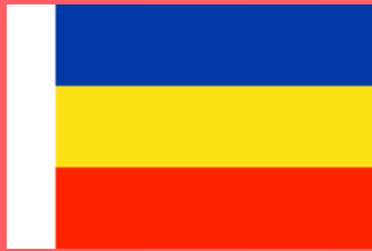
РОСТОВСКАЯ ОБЛАСТЬ (Ростов-на-Дону)