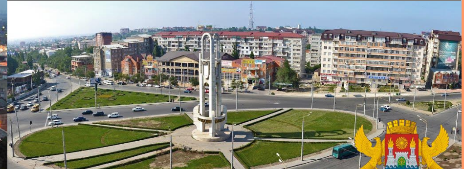
МАХАЧКАЛА (622 000)