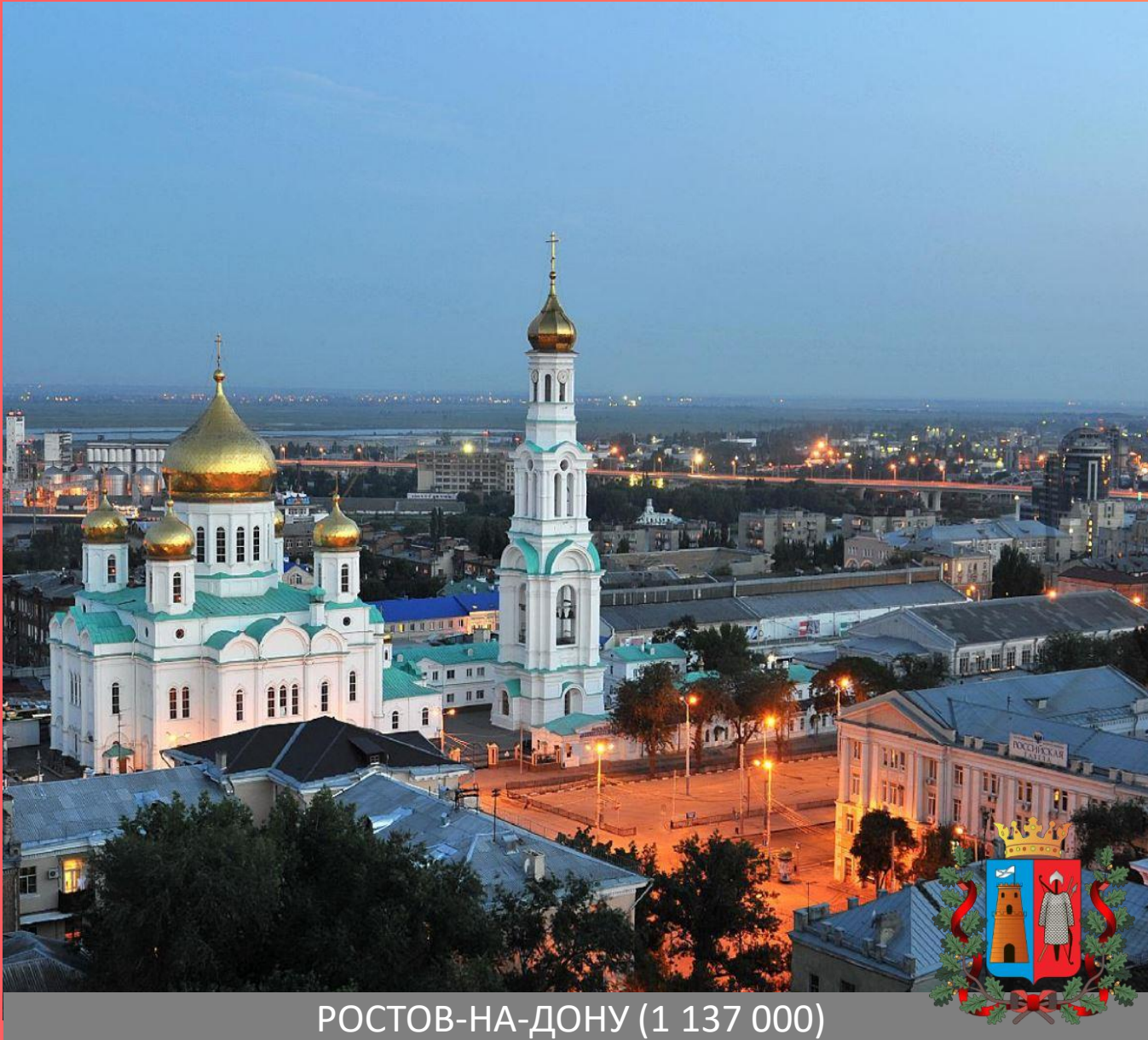
РОСТОВ-НА-ДОНУ (1 137 000)