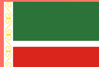
ЧЕЧЕНСКАЯ РЕСПУБЛИКА (Грозный)