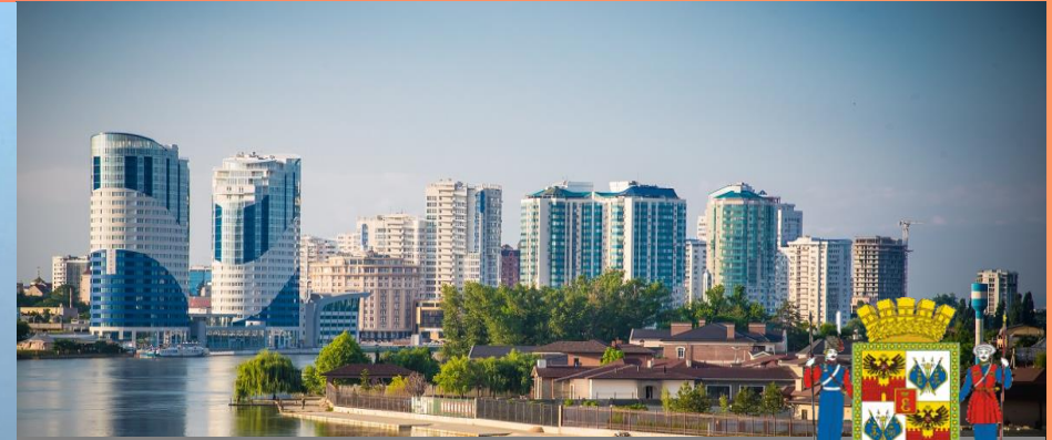
КРАСНОДАР (1 121 000)