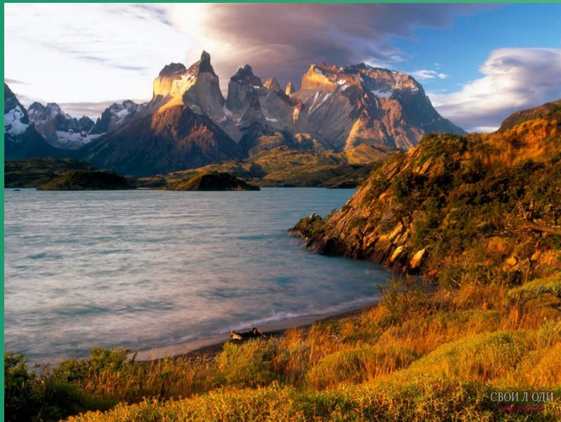
СВОИ Л О Д И